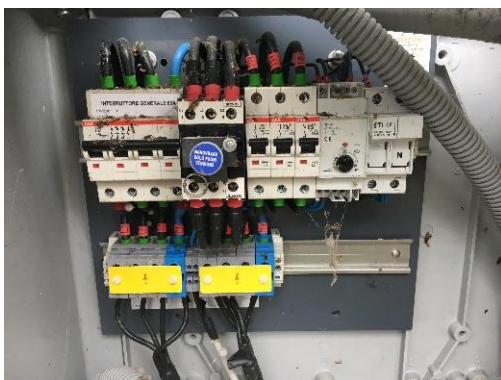
Figura 7 – Loc. Fabbrica – Punto di consegna C2 oggetto di messa a norma