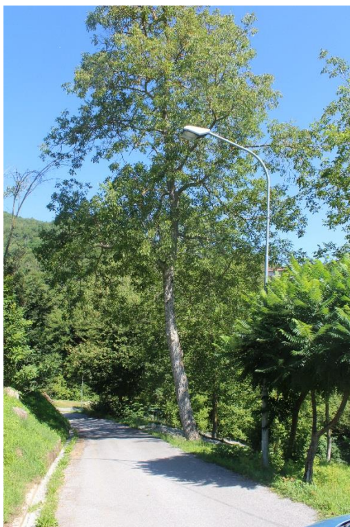
Figura 3 – Strada in prossimità della Cappella di San Bartolomeo – Tratto di strada oggetto di installazione nuovi punti luce e di sostituzione delle armature esistenti (tipo stradale).