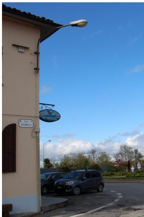
Figura 4 – Rotatoria in prossimità della SP661 – Tratto con armature tipo stradale oggetto di sostituzione.