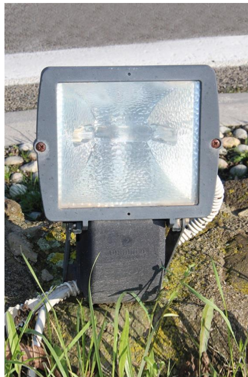
Figura 10 – Rotatoria tra SP28bis e Via Roma con proiettori oggetto di sostituzione.