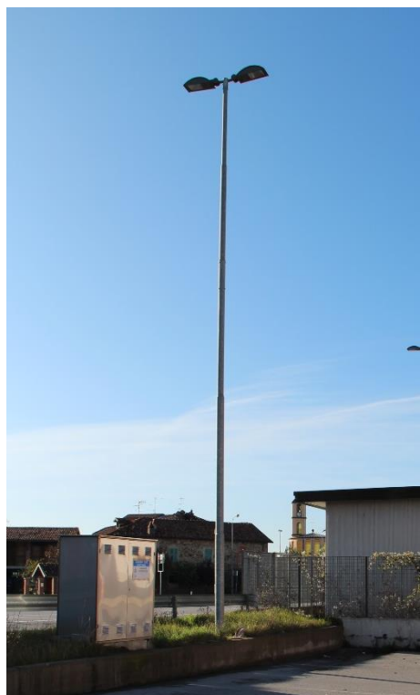
Figura 15 – SP28bis Reg. San Bernardino - Tratto con armature tipo stradale oggetto di sostituzione.