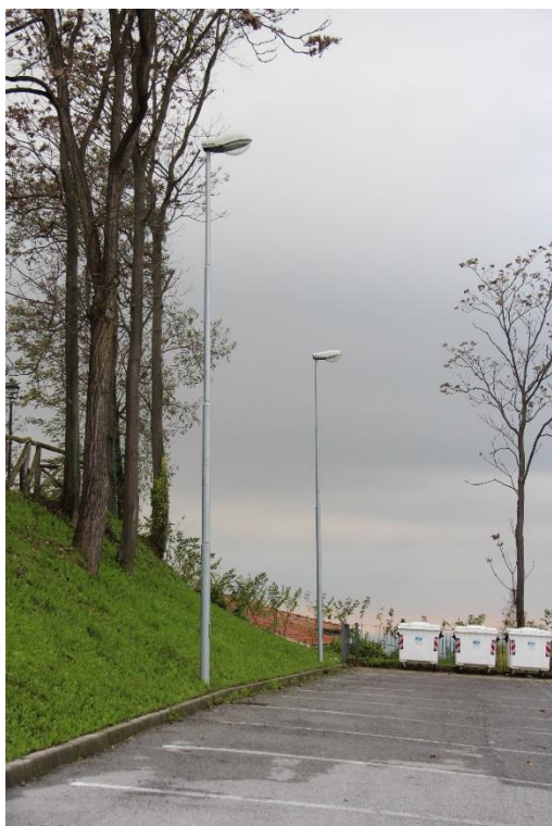
Figura 3 – Area a parcheggio in prossimità della Chiesa di S. Pietro e Paolo – Tratto con armature tipo stradale oggetto di sostituzione.