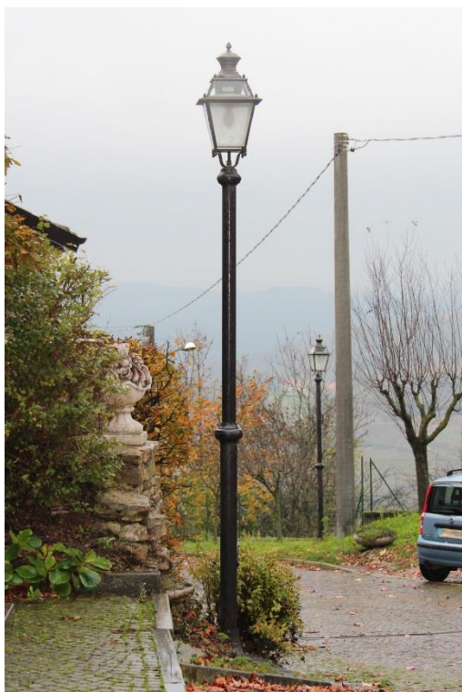
Figura 1 – Piazzale del Municipio – Tratto con armature tipo lanterna oggetto di retrofit.