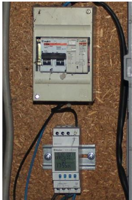
Figura 6 – Loc. Luschetti – Punto di consegna C2 oggetto di messa a norma.