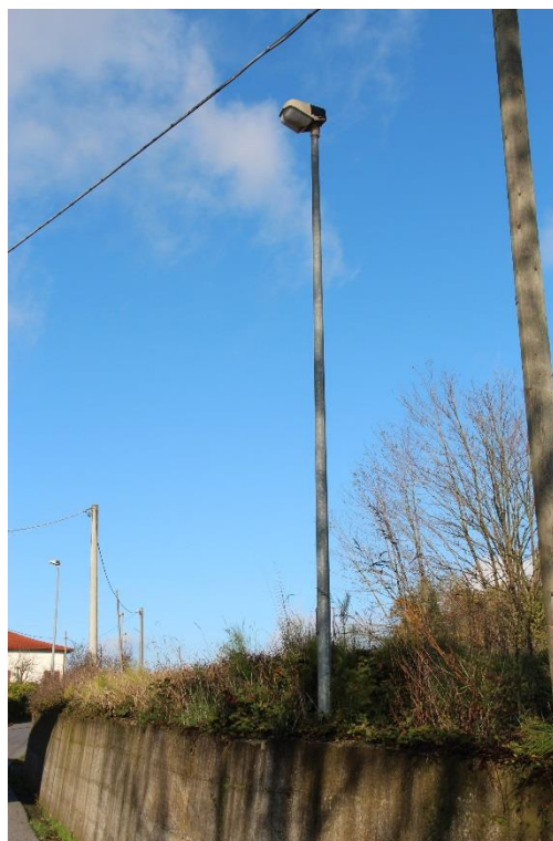
Figura 8 – Strada in Loc. Pozzo – Tratto con armature tipo stradale oggetto di sostituzione.