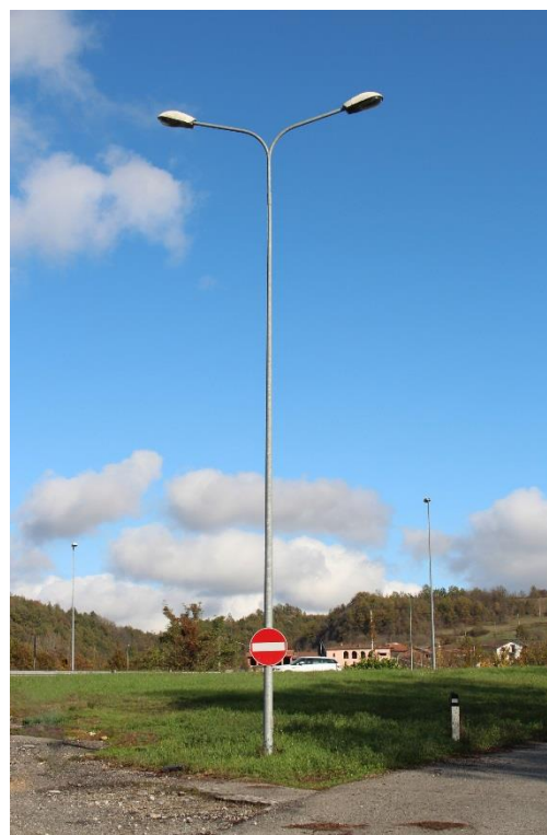
Figura 6 – Strada in prossimità della rotatoria lungo SP28bis e Via Roma – Tratto con armature tipo stradale oggetto di sostituzione.