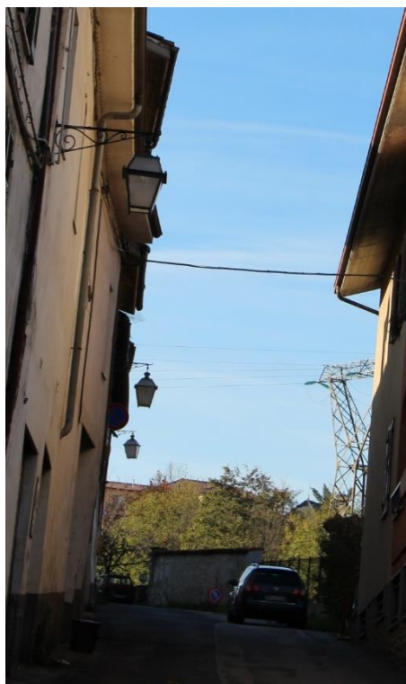
Figura 10 – Via Regina Margherita - Tratto con armature a lanterna oggetto di retrofit.