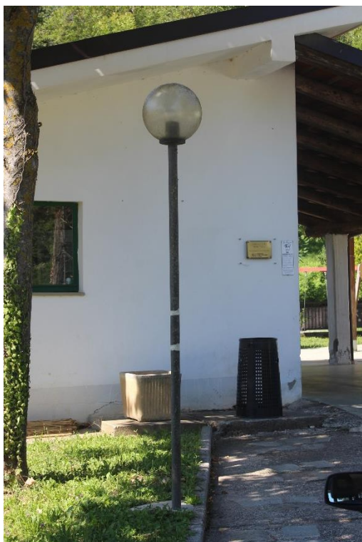
Figura 7 – Area denominata "Posto Tappa" – Tratto con armature tipo sfera oggetto di sostituzione.