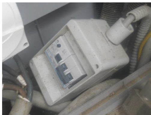
Figura 8 – Frazione Stelle – Punto di consegna C12 oggetto di messa a norma.