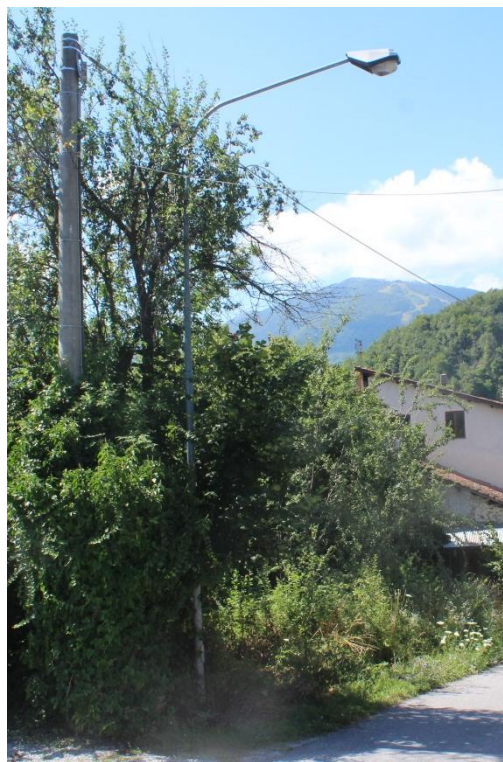
Figura 2 – SP34 – Tratto con armature tipo stradale oggetto di sostituzione.