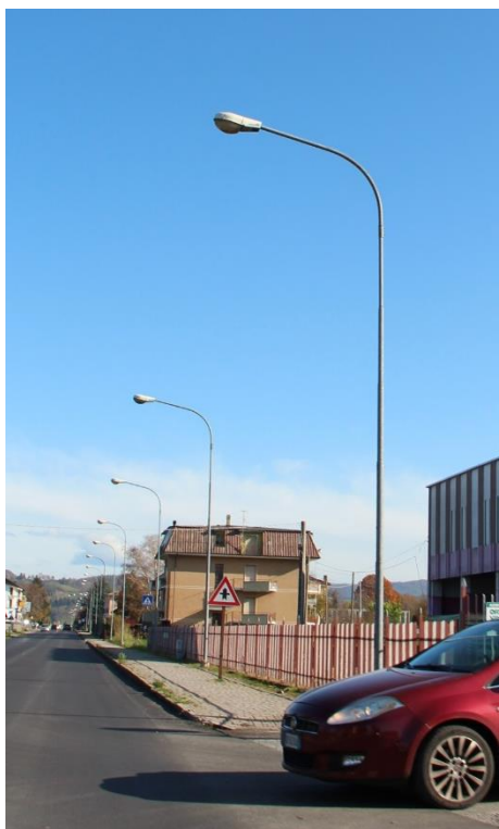
Figura 1 – SS28 in prossimità della Strada del Cabanone – Tratto con armature tipo stradale oggetto di sostituzione.