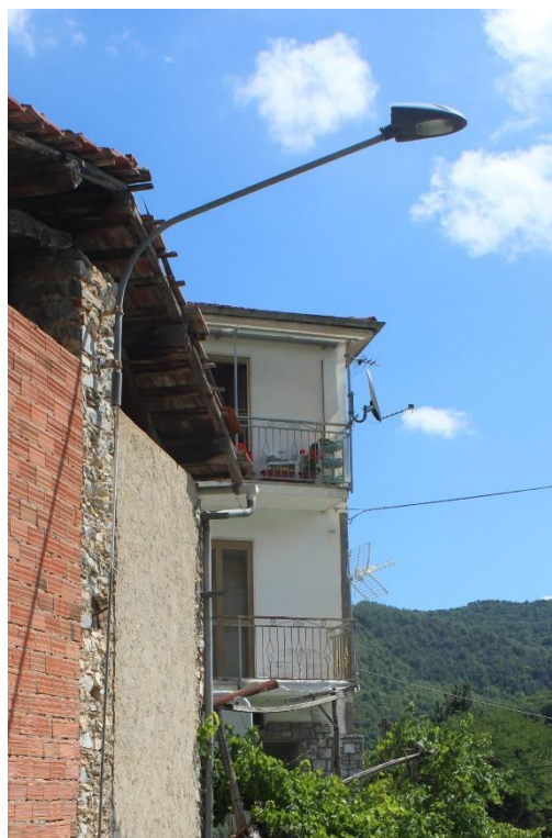
Figura 4 – SP34 – Tratto con armature tipo stradale oggetto di sostituzione.