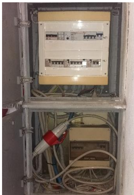
Figura 8 – Via Capris - Punto di consegna C1 oggetto di messa a norma