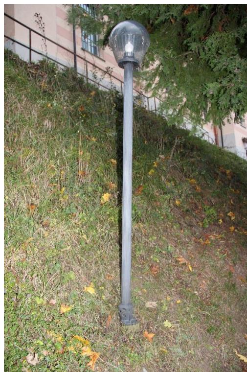
Figura 2 – Percorso pedonale di accesso la piazzale del Municipio – Tratto con armature a sfera oggetto di sostituzione.