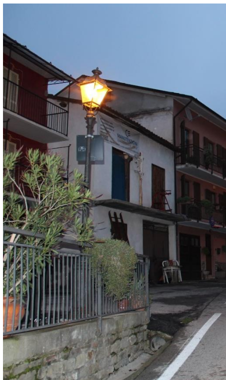
Figura 2 – SP115 – Tratto con armature tipo lanterna oggetto di retrofit.