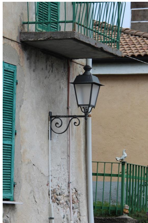
Figura 4 – Via Borgo – Tratto con armature tipo lanterna oggetto di retrofit.