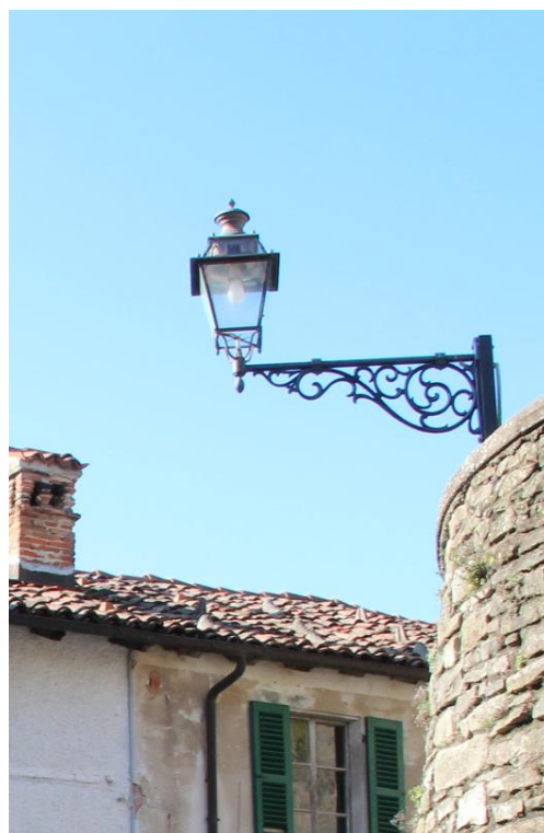
Figura 2 – Via Villa – Tratto con armature tipo lanterna oggetto di retrofit.