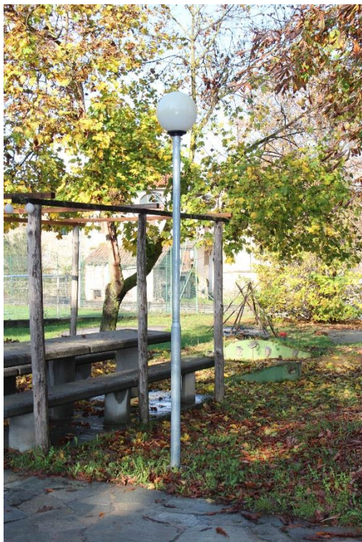
Figura 9 – Area verde attrezzata in Via Castelnuovo – Tratto con armature a sfera oggetto di sostituzione.