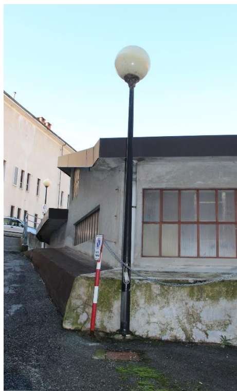
Figura 9 – Strada laterale di Via Regina Margherita – Tratto con armature a sfera oggetto di sostituzione.