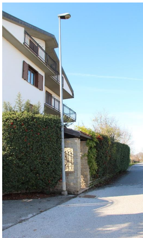
Figura 5 - Strada del Cabanone - Tratto di strada oggetto di installazione nuovi punti luce e di sostituzione delle armature esistenti (tipo stradale).