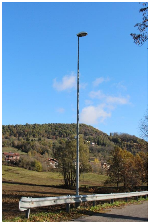
Figura 3 – Via Roma – Tratto con armature tipo stradale oggetto di sostituzione.