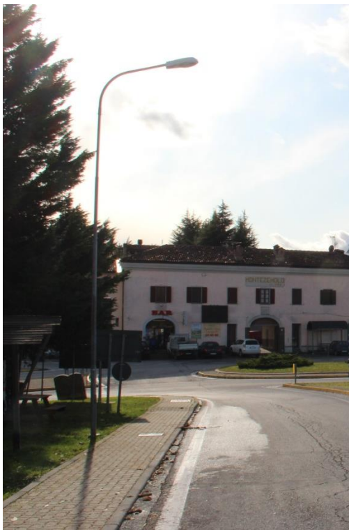
Figura 5 – SP661 – Tratto con armature tipo stradale oggetto di sostituzione.