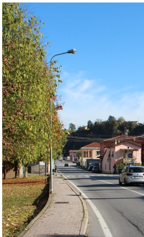
Figura 11 – SP225 in prossimità di Via Filatoio – Tratto con armature tipo stradale oggetto di sostituzione.