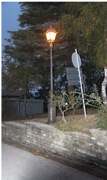
Figura 4 – SP115 in prossimità del Municipio – Tratto con armature tipo lanterna oggetto di retrofit.