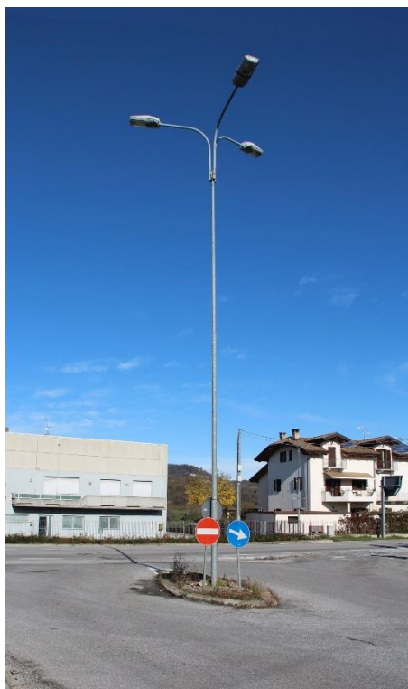
Figura 16 – Incrocio tra Via San Bernardino e SP353 – Tratto con armature tipo stradale oggetto di sostituzione.