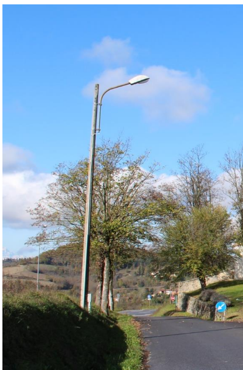
Figura 1 – Via Villa – Tratto con armature tipo stradale oggetto di sostituzione.