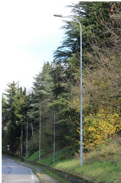
Figura 2 – SP209 – Tratto con armature tipo stradale oggetto di sostituzione.