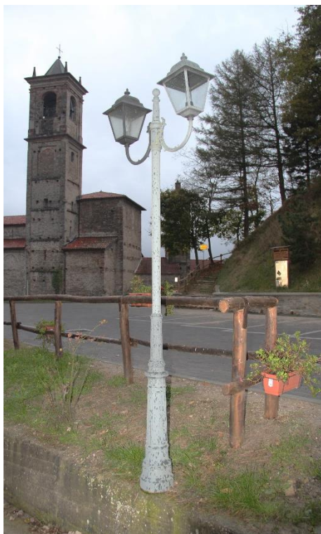
Figura 1 – Via G. B. Romano – Tratto di strada oggetto di installazione nuovi punti luce e con armature tipo lanterna oggetto di retrofit.