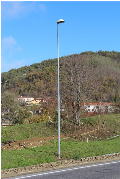
Figura 1 – Via Circonvallazione – Tratto con armature tipo stradale oggetto di sostituzione.