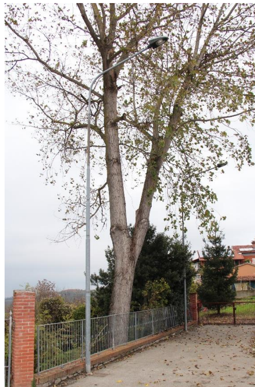
Figura 2 – Area a parcheggio in prossimità dell'Ufficio Postale – Tratto con armature tipo stradale oggetto di sostituzione.