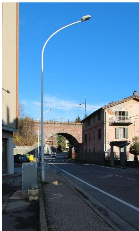
Figura 13 – SP54 – Tratto con armature tipo stradale oggetto di sostituzione.