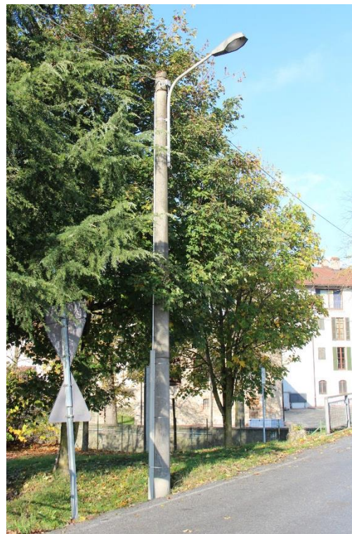
Figura 2 – SP55 – Tratto con armature tipo stradale oggetto di sostituzione.