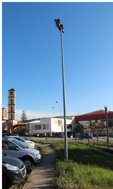
Figura 18 – Reg. San Bernardino - Parcheggio in prossimità dell'ospedale con proiettori oggetto di sostituzione.