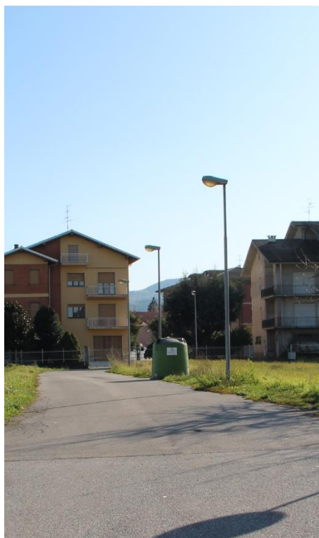
Figura 2 – Via Comino – Tratto con armature tipo stradale oggetto di sostituzione.