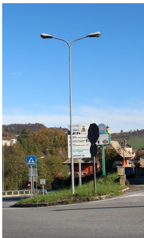
Figura 7 - Incrocio tra SS28 e Via Regina Margherita - Tratto con armature tipo stradale oggetto di sostituzione.