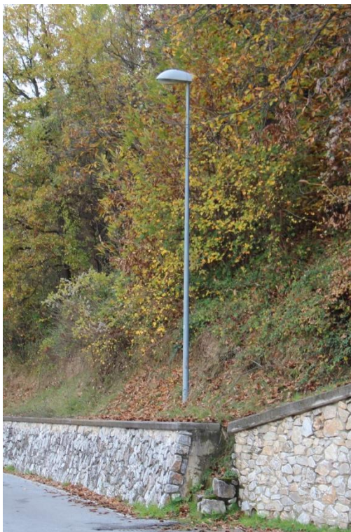
Figura 1 – Via Cavalieri di Vittorio Veneto – Tratto con armature tipo stradale oggetto di sostituzione.