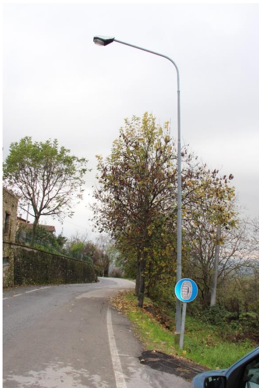
Figura 1 – SP126 in prossimità dell'Ufficio Postale – Tratto con armature tipo stradale oggetto di sostituzione.