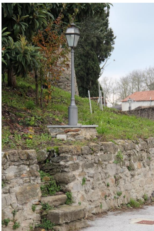
Figura 7 – Piazza Castello - Tratto con armature tipo lanterna oggetto di retrofit.