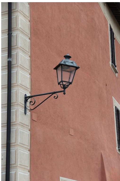
Figura 5 – SP126 in prossimità dell'Ufficio Postale – Tratto con armature tipo lanterna oggetto di retrofit.