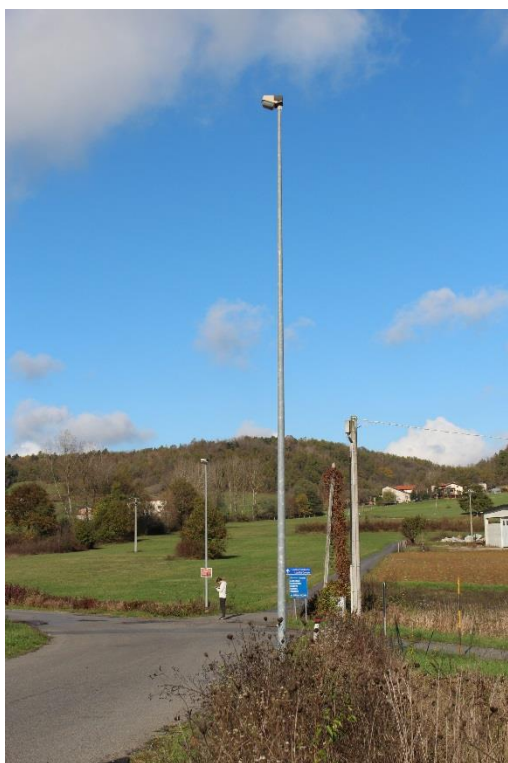
Figura 5 – Via Strada Vecchia – Tratto con armature tipo stradale oggetto di sostituzione.