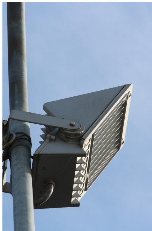
Figura 6 – SP661, nei pressi dell'area verde attrezzata – Proiettore oggetto di sostituzione.