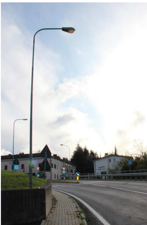
Figura 3 – SP28bis – Tratto con armature tipo stradale oggetto di sostituzione.