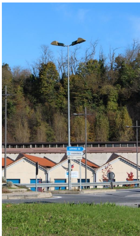
Figura 12 – Rotatoria lungo la SP225 in prossimità di Via Pio Bocca – Tratto con armature tipo stradale oggetto di sostituzione.