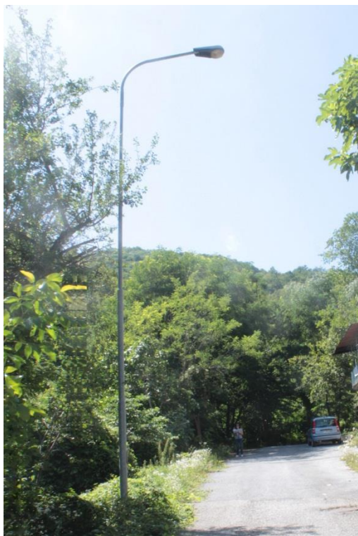
Figura 5 – SP34 – Tratto con armature tipo stradale oggetto di sostituzione.