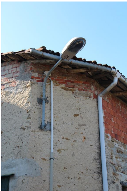
Figura 5 – Loc. Luschetti – Tratto con armature tipo stradale oggetto di sostituzione.