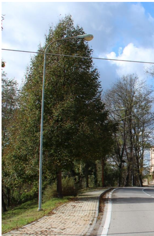
Figura 1 – SP661 in prossimità della Chiesa di S. Benedetto – Tratto con armature tipo stradale oggetto di sostituzione.