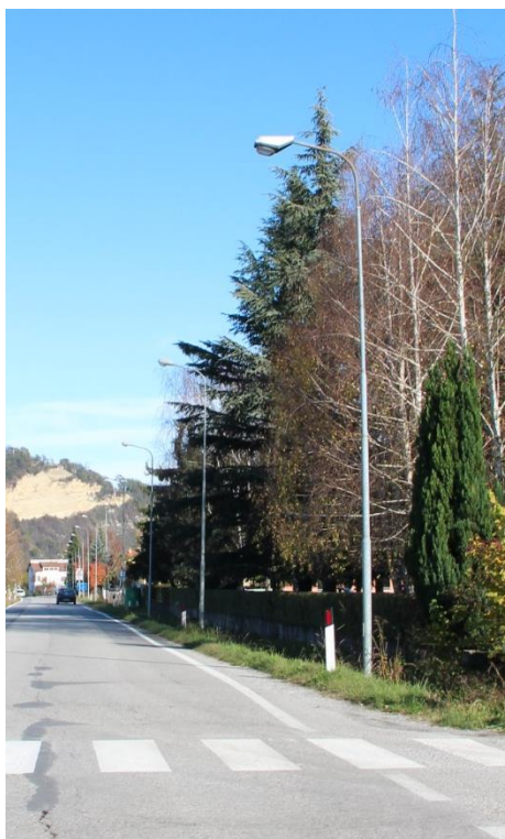
Figura 3 – SP101 – Tratto con armature tipo stradale oggetto di sostituzione.