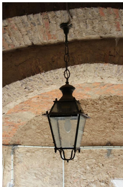
Figura 4 – Passaggio pedonale in Via Salita alla Parrocchia – Tratto con armature tipo lanterna oggetto di retrofit.