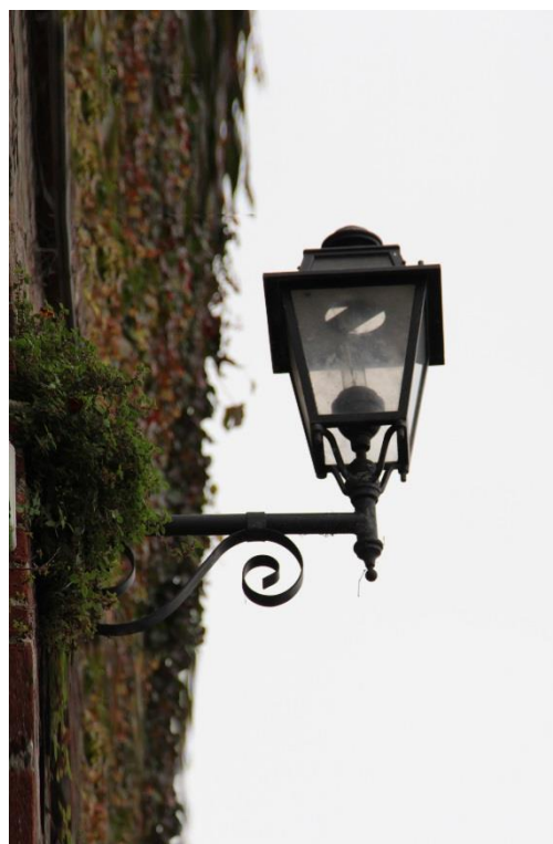
Figura 6 – Piazza Castello – Tratto con armature tipo lanterna oggetto di retrofit.