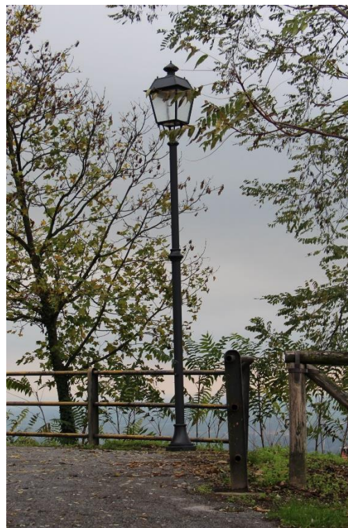
Figura 4 – Area antistante la Chiesa di S. Pietro e Paolo – Tratto con armature tipo lanterna oggetto di retrofit.