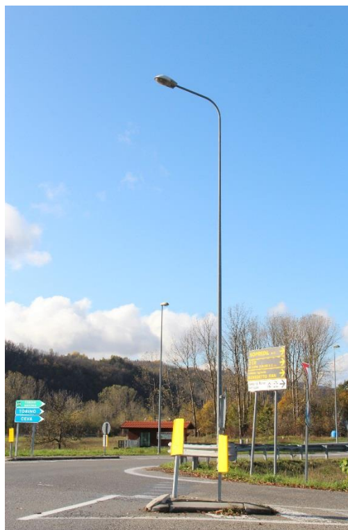
Figura 4 – Rotatoria tra SP28bis e Via Roma – Tratto con armature tipo stradale oggetto di sostituzione.