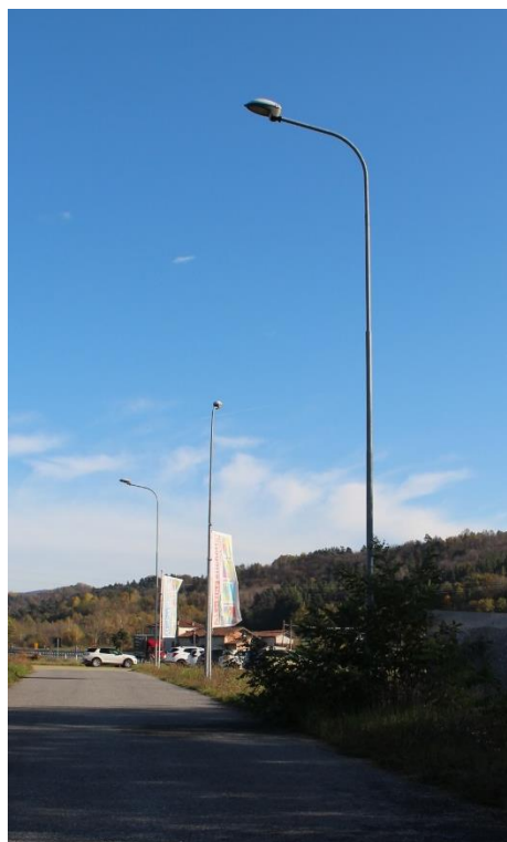
Figura 17 – Strada in Reg. San Bernardino in prossimità del cavalcavia SP353 - Tratto con armature tipo Stradale oggetto di sostituzione.