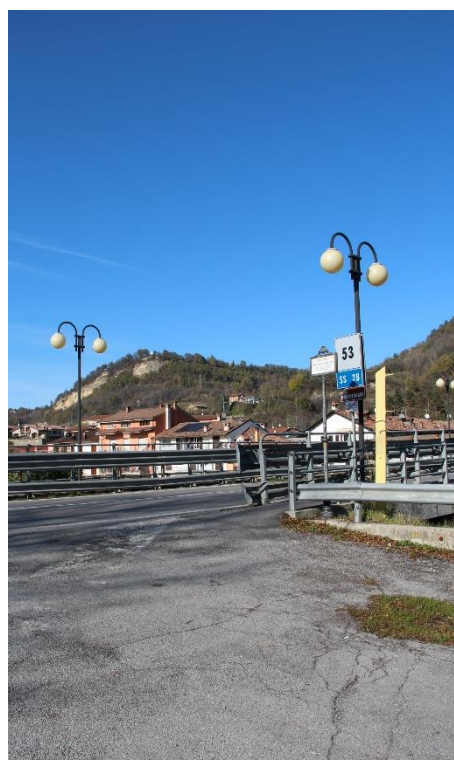
Figura 8 - SS28 in prossimità di C.so IV Novembre - Tratto con armature a sfera oggetto di sostituzione.