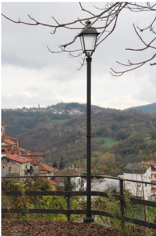
Figura 3 – Via Borgo in prossimità della chiesa – Tratto con armature tipo lanterna oggetto di retrofit.