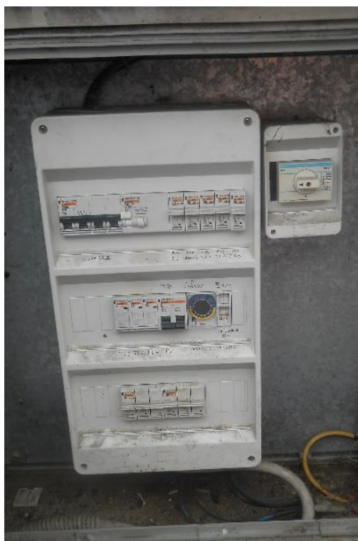
Figura 5 – Via Cavalieri di Vittorio Veneto – Punto di consegna C5 oggetto di messa a norma.