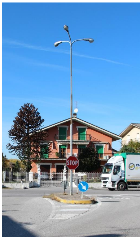
Figura 4 – Incrocio tra SP143 e SP101 – Tratto con armature tipo stradale oggetto di sostituzione.