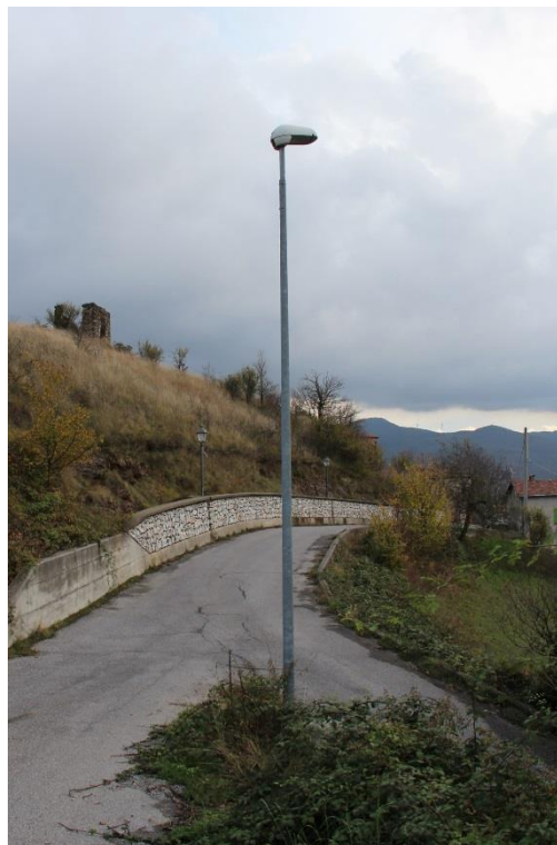
Figura 2 – Prosecuzione di Via Borgo – Tratto con armature tipo stradale oggetto di sostituzione.