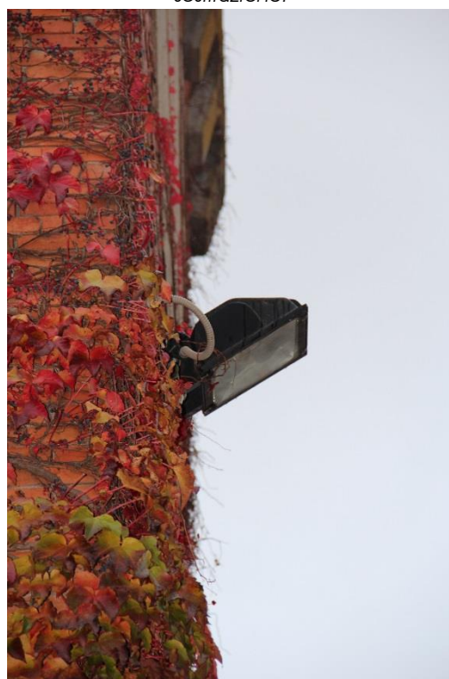
Figura 4 – Piazzale del Municipio – Proiettore oggetto di sostituzione.