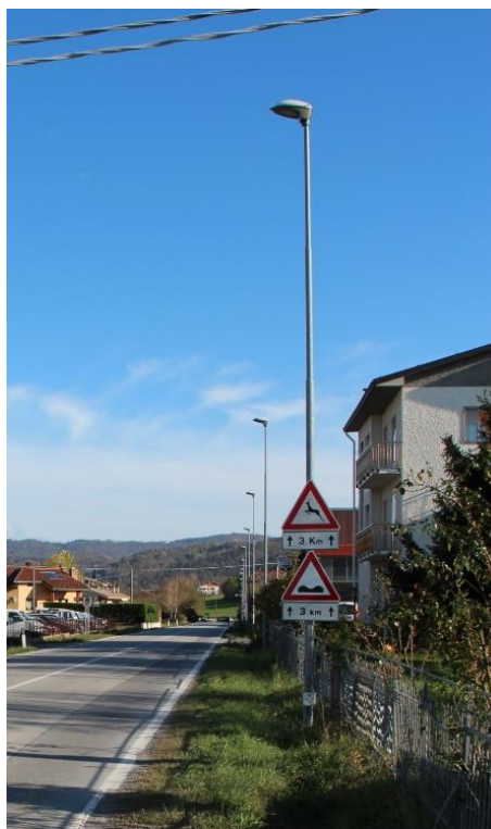
Figura 14 – SP28bis Reg. San Bernardino - Tratto con armature tipo stradale oggetto di sostituzione.