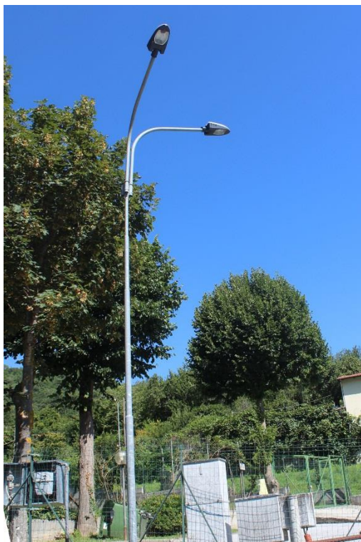
Figura 1 – SP34 in prossimità dell'area sportiva – Tratto con armature tipo stradale oggetto di sostituzione.