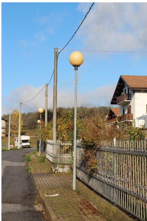
Figura 7 – Strada verso Loc. Pozzo – Tratto con armature a sfera oggetto di sostituzione.