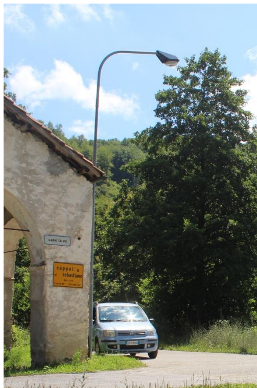
Figura 6 – Via Costa di Cane – Tratto con armature tipo stradale oggetto di sostituzione.