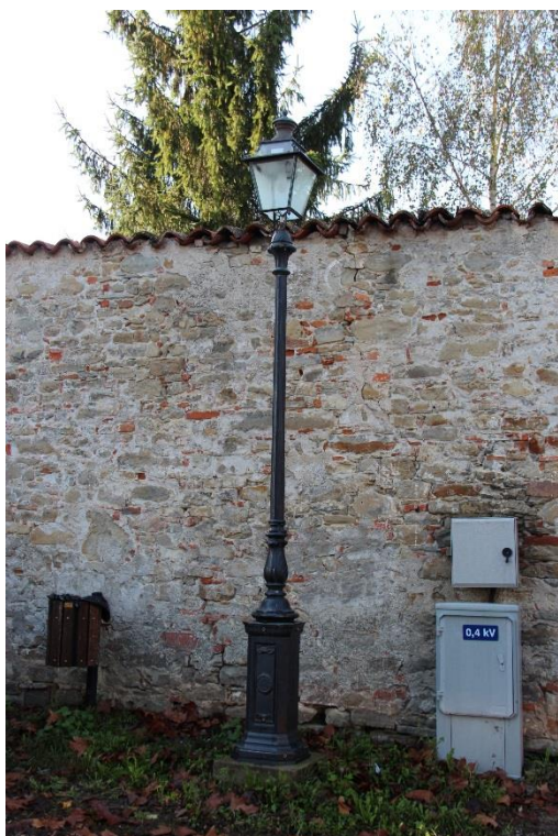
Figura 3 – Via Salita alla Parrocchia – Tratto con armature tipo lanterna oggetto di retrofit.