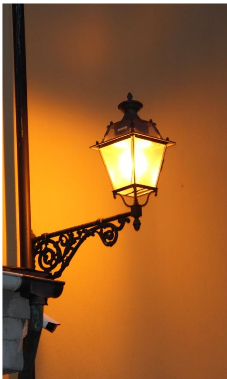
Figura 3 – SP115 in prossimità del Municipio – Tratto con armature tipo lanterna oggetto di retrofit.